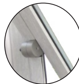
Bisagras con eje de giro horizontal con retención a 25°

CE EN 14351-1 LGAI Technological Center, S.A (APPLUS) Organismo notificado nº0370